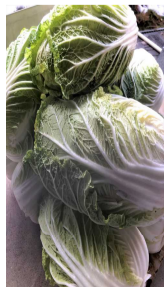
いつもありがとうございます。