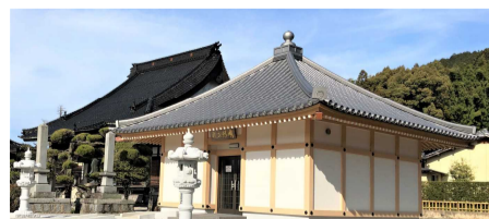
新納骨堂・次第に埋まりつつあります。