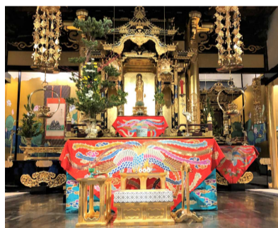
2022、12/20四日市別院お荘厳は出来てましたが、報恩講中止。コロナ感染のため