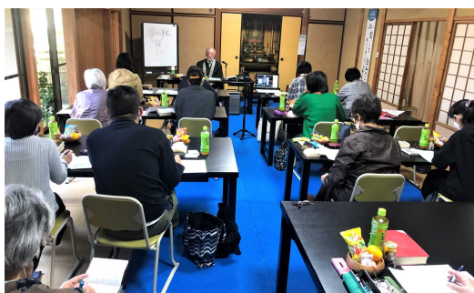
10/19坊守学習会、於念信寺