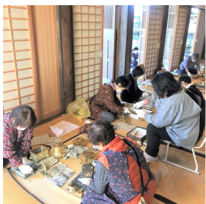
10/21御正忌おみぎき、上高屋 仏教婦人会、今年は早めに