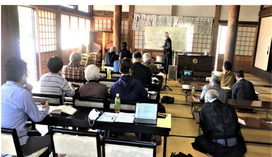
10/13、14・京都組育成員研修、於通善寺