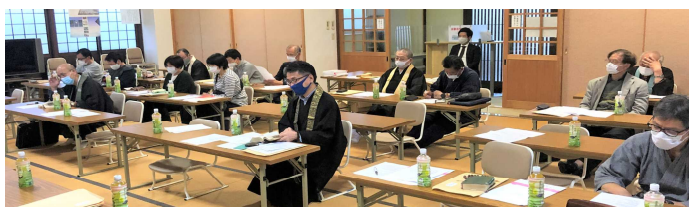
10/22京都組会、於真念寺