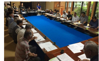
念信寺世話人会議