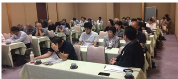
京都組教化委員会