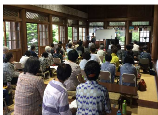
行橋小組婦人研修